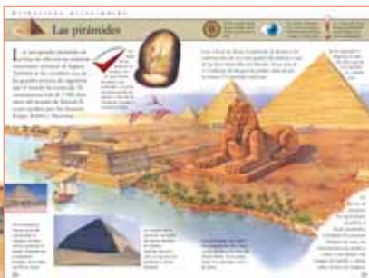
En detalladas ilustraciones a todo color verás fantásticos paisajes de los lugares más importantes de estas civilizaciones antiguas.