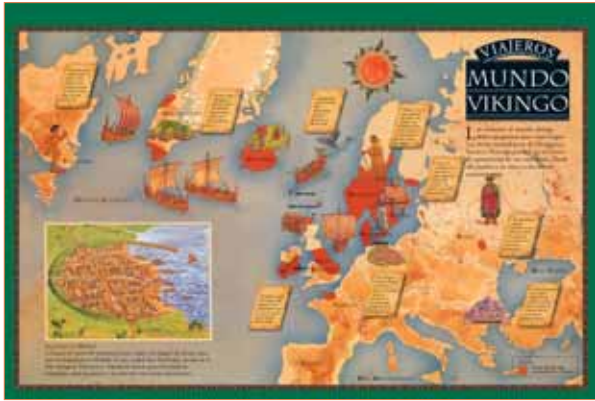
Al final de cada libro, un mapa a todo color te muestra los principales atractivos turísticos, para que tengas unas vacaciones inolvidables.