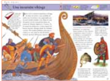
Las vivas ilustraciones a todo color te muestran cómo eran sus costumbres, y para que no cometas errores de etiqueta: por ejemplo, si eres mujer y vas de compras al mercado egipcio, solo debes comprar joyas y perfume, ¡averigua por qué!