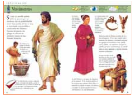
Como buenas guías de turismo, estos libros te dicen cómo vestirte y peinarte en cada época y región que visites.