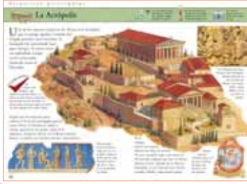
Verás las grandes edificaciones antiguas, como El Coliseo romano o La Acropolis griega, en su máximo esplendor.